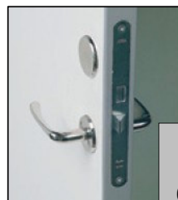
ASSA 565 & 696 Håndtag